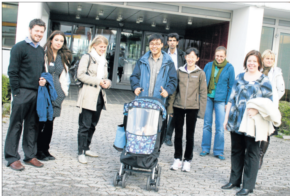
Her er holdets deltagere fotograferet foran Hotel Hvide Hus, inden de begav på en kulturel byvandring i Køge.