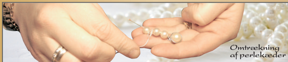
Omtrækning af perlekæder