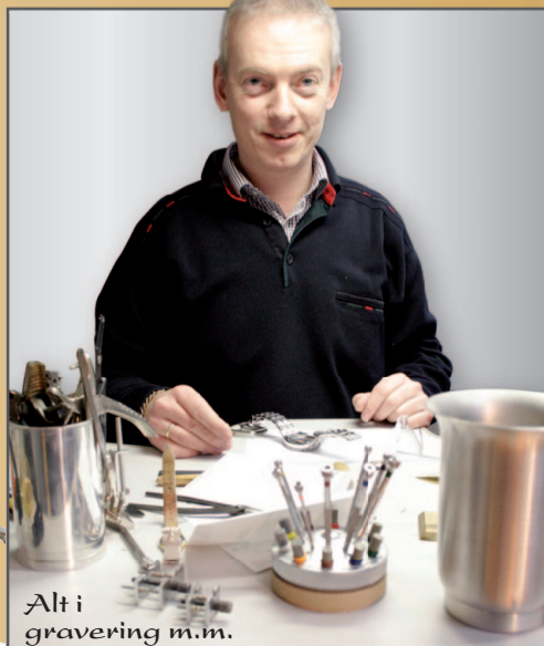
Alt i gravering m.m.