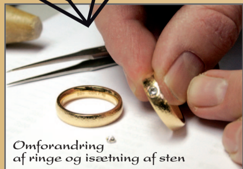
Omforandring af ringe og isætning af sten