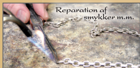
Reparation af smykker m.m.