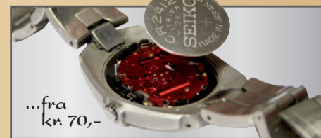
...fra kr. 70,-